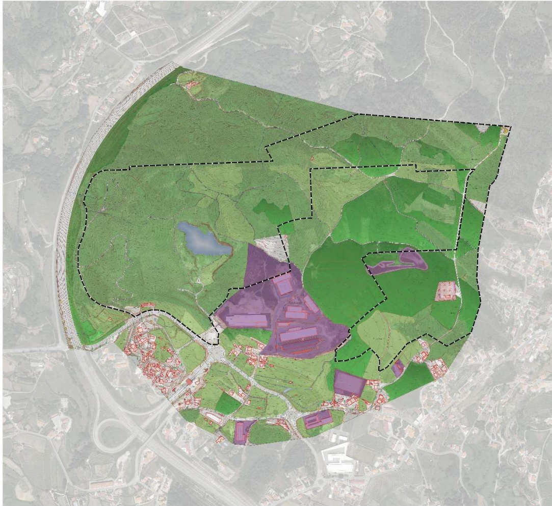
PLANO DE PORMENOR DO ALTO DAS BARRANCAS | ÁREA DE INTERVENÇÃO